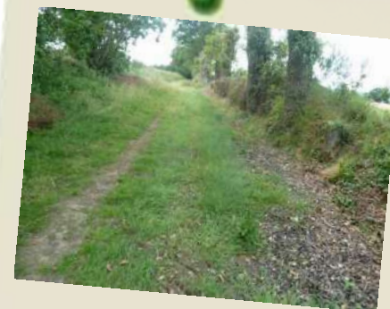
Chemin de l'Oisellerie

9 Rejoindre le bord du plan d'eau et tourner à droite pour en faire le tour et retrouver le parking de la rue Alain Gerbault.