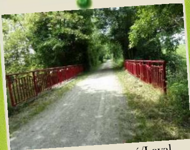
Voie Verte Renazé/Laval