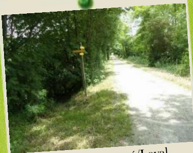
Voie Verte Renazé/Laval